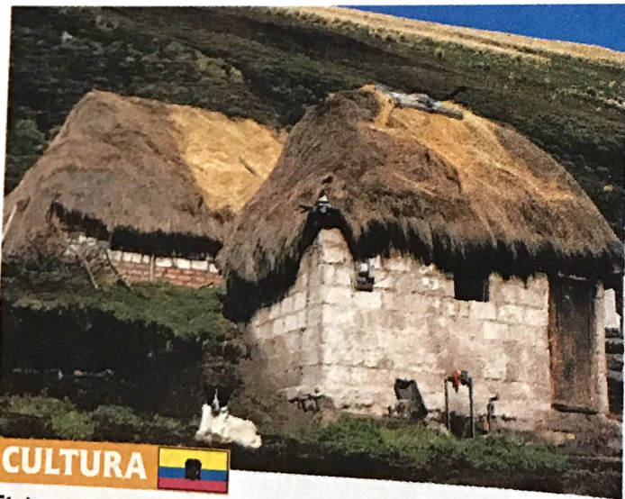
Típica casa rural en la provincia de Chimborazo, Ecuador