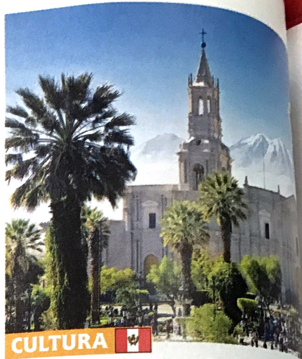
Plaza de Armas, Arequipa, Perú